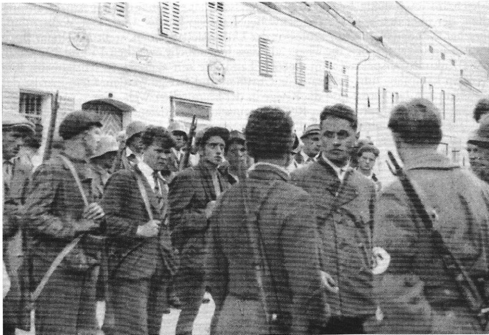
Juliputschisten auf dem Hauptplatz von St. Veit an der Glan, Kärnten, 26. oder 27. Juli 1934