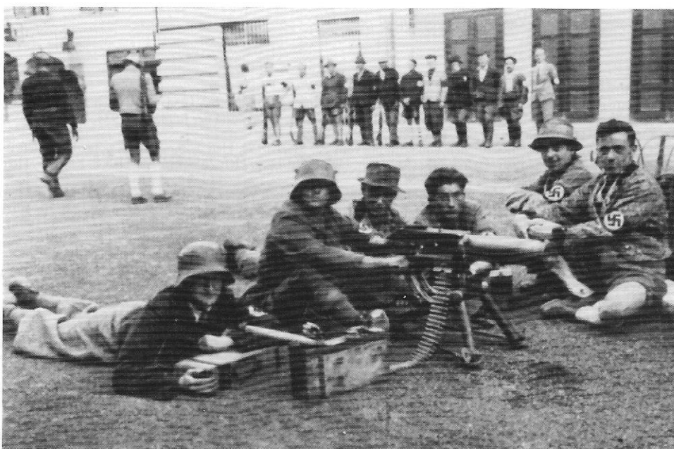
Juliputschisten in St. Andrä im Lavanttal, Kärnten, 27. Juli 1934 (aus: Otto Reich von Rohrwig, Der Freiheitskampf der Ostmark-Deutschen , Graz – Wien – Leipzig 1942)

Allerdings: Dieser „demografische Stressfaktor“ war in der österreichischen Ersten Republik ebenfalls vorhanden, nämlich ein „Überschuss“ an jungen Männern, für die es keinen adäquaten Platz in der Gesellschaft gab. Das Gewaltpotential, das von Jugendlichen ausgeht, die sich in ihren Lebenschancen behindert sehen, hat die österreichische Gesellschaft in den Jahren 1933 bis 1938 und im Juliputsch erfahren. Und dabei – so möchte ich schließen – handelt es sich um ein Phänomen, das weit über die österreichische Zeitgeschichte und über die Nationalsozialismusforschung hinausreicht.